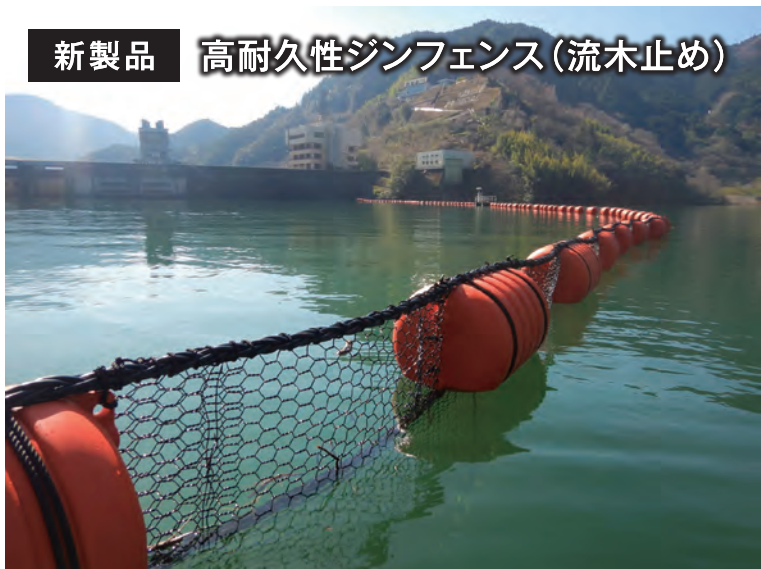
新製品 高耐久性ジンフェンス(流木止め)