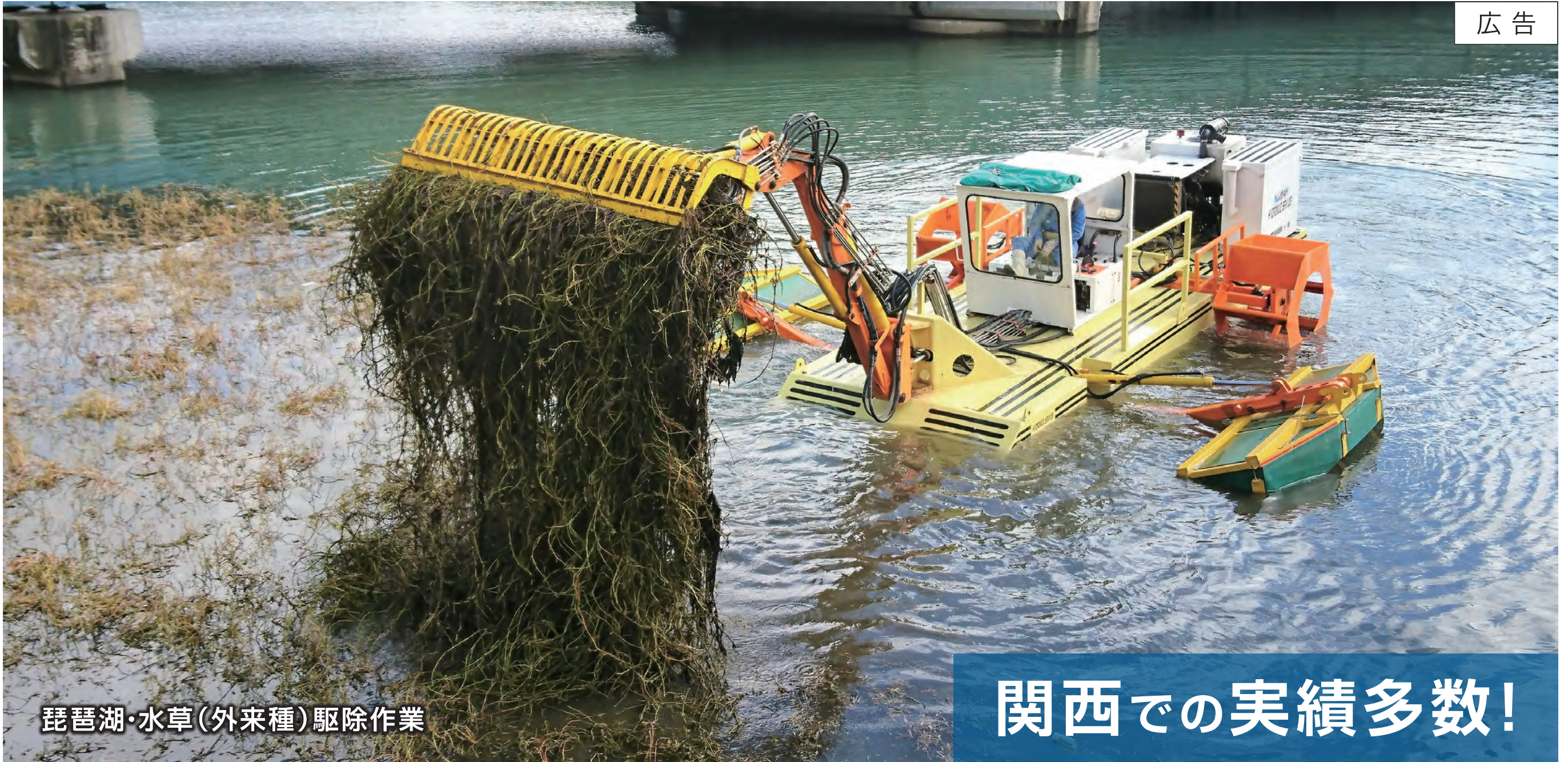
琵琶湖・水草(外来種)駆除作業