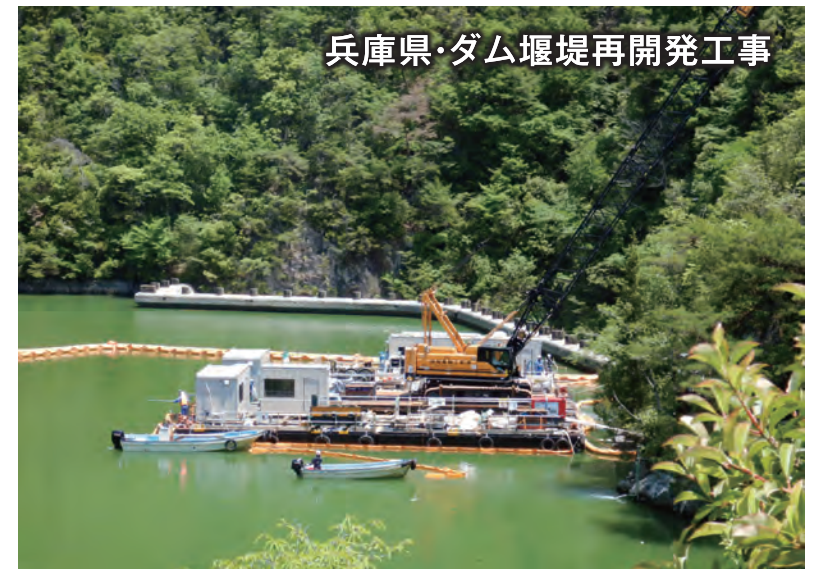
兵庫県・ダム堰堤再開発工事